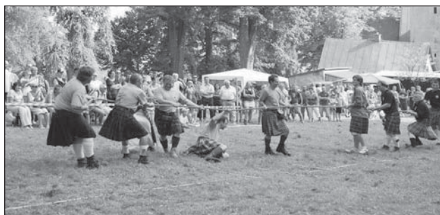
□ Souboj klanů v přetahování lanem.

Letošní Anenská pout' je minulostí. Rád bych proto poděkoval všem, kteří se o její hladký průběh jakkoliv zasloužili.