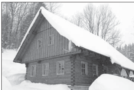
❑ Povedená novostavba roubenky nejen lahodí oku, ale je v ní příjemné a zdravé bydlení.

Roubenky jsou stavby, jejichž stěny jsou zbudovány technikou roubení. Trámy kladené vodorovně na sebe jsou v rozích spojovány různými typy tesařských vazeb. K provedení řádného roubení na našem území patří takové úpravy nároží, které nevyžadují přesahy trámů (kromě horních věnců). Pro stavbu se používají trámy hraněné, zaručující lepší soudržnost stavby. Fázky (stržení hran trámů) jsou zhotoveny ručně (pořizem) nebo strojově (frézou). Ručně stržené hrany vzbuzují dojem starodobého vzhledu, naproti tomu strojově stržené hrany vypadají spíše moderně. Základní, dlouhodobě užívaná je rohová vazba na tzv. rybinu, ve které má konec každého trámu při bočním pohledu tvar připomínající rybí ocas. Vyjetí prvku z vazby se zamezuje protiběžně šikmým seřiznutím či spíše ztesáním dosedajících ploch. Mladší způsob vazby, který se ve vesnickém prostředí postupně objevoval od závěru 18. století, představuje vazba na tzv. zámky - systém nahrazující šikmé plochy soustavou kolmo zalamaných vodorovných a svislých plošek. Mezery mezi hranoly se vyplňují přírodní izolací, nejčastěji ovčí nebo minerální vlnou. Izolace se zakrývá dřevěnými lištami.