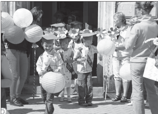
☐ V červnu se děti na MÚ rozloučily s Mateřskou školou v Rokytnici.