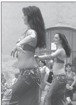
□ Vystoupení orientálních tanečnic na zámeckém nádvoří

vaný obraz Městečka Rokytnice z pol. 18. století. Během celého dne probíhaly prohlídky zámku s průvodcem.