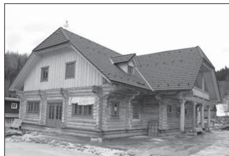
❑ Sruby jsou doma třeba v Kanadě, na území CHKO působí cizí.

Z hlediska konstrukce jsou tedy hlavní rozdíly mezi sruby a výše zmiňovanými roubenkami především v úpravě nosných dřevěných prvků tvořících obvodové stěny (kulatiny resp. trámů) a provedené charakteristické nárožní vazbě.