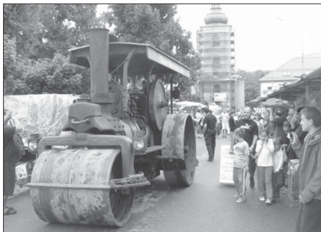
□ Velkou atrakcí pouti byl historický parní válec, který se vydal na projížďku městem.